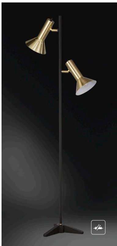
Wortmann & Filz GmbH · Im Langel 6 · 59872 Meschede-Freienohl Phone +49 (0) 29 03 / 449-0 · Fax +49 (0) 449-114 · www.wofi.de · info@wofi.de